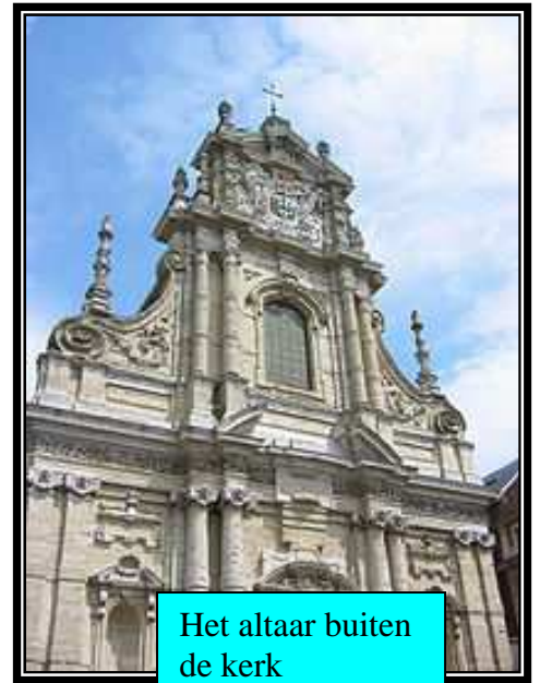
Het altaar buiten de kerk

Een van de klokken van de Sint – Jacobskerk hangt buiten de kerk.