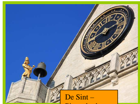
De Sint – Pieterskerk