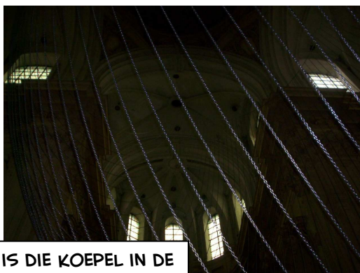
DIT IS DIE KOEPEL IN DE SINT-MICHIELSKERK