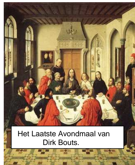
Het Laatste Avondmaal van Dirk Bouts.