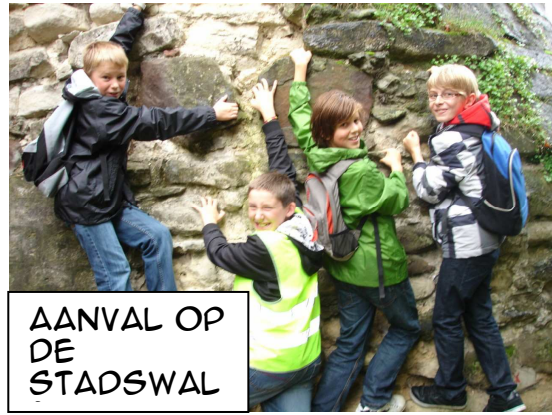
AANVAL OP DE STADSWAL