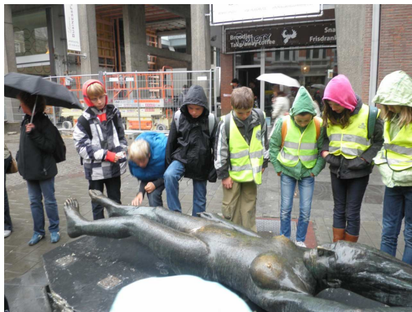
Dit is fiere