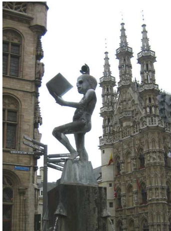
Dit is ons Fonske op het Fochplein.

De kotmadam bijvoorbeeld. → We mochten allemaal op haar schoot gaan zitten! Ze staat op de oude markt.