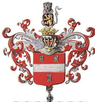
Dit is het schild van Leuven

De meester zei dat ze nog niet vaak op de zolder geweest waren maar wij hadden geluk want we hadden een leuke gids.